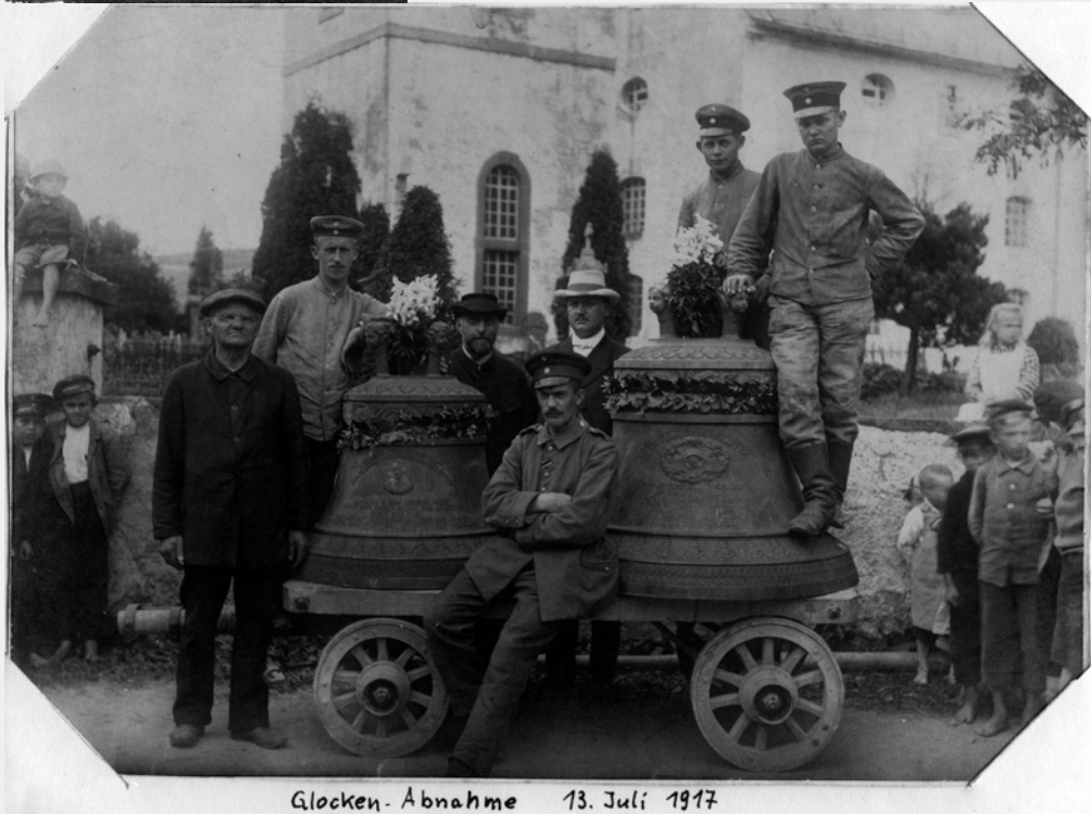
Glocken-Abnahme 13. Juli 1917

Leider gibt es diese Glockengießerei in Kleinwelka nicht mehr, doch die außerordentlich gute Qualität und viele ansprechend gestaltete Glocken in vielen Kirchen dokumentieren die gute Arbeit dieser Manufaktur. Auch unsere Kirche besaß 3 Glocken aus deren Herstellung. Leider forderte der 1. Weltkrieg die Abgabe.